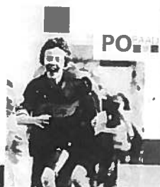
Ontwikkelingsperspectief in het basisonderwijs

Clijisen, A, Spaans, G, Hollenberg, J, Pameijer, N. & A.J.C Struiksma (2013). Ontwikkelingsperspectief in het basisonderwijs. Utrecht: PO-Raad.